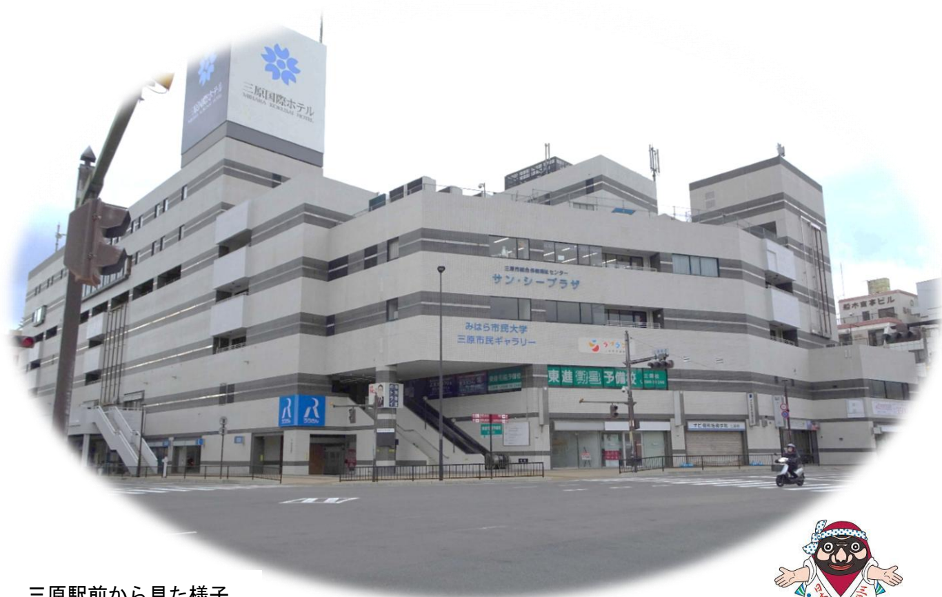
三原駅前から見た様子